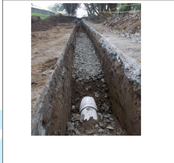
Instalación de tubería y relleno con material importado.

El contratista encargado de la ejecución de la rehabilitación del pozo profundo del municipio de la Victoria, Unión Temporal la Victoria 2017, se encuentra adelantado las siguientes actividades: Suministro de tubería y accesorios PVC presión de 10" RDE 13.5, excavaciones a máquina, instalación de tubería PVC presión RDE 13.5 D=10", suministro e instalación de material de filtro, relleno con material importado y con material seleccionado de la excavación, compactación mecánica, instalación de accesorios, construcción de anclajes, entre otros.