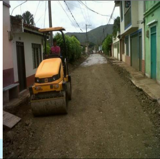
CONFORMACIÓN DE SUB-BASE GRANULAR TIPO ROCAMUERTA PARA VIA DE LA CARRERA 7