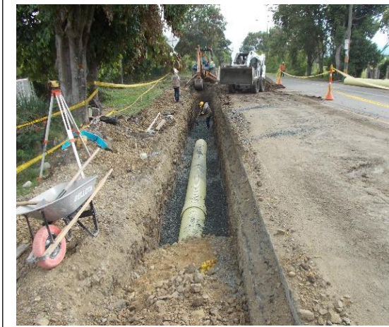
Suministro e instalación de material de filtro y tubería PVC.