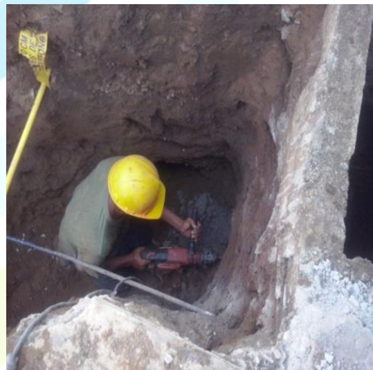
CONEXIÓN DE DOMICILIARIAS A CAJAS DE INSPECCIÓN SANITARIAS