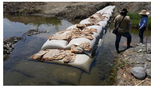
Bolsacretos terminados espólón No. 1