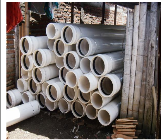
Suministro de tubería PVC Presión Diámetro 10" RDE 13.5