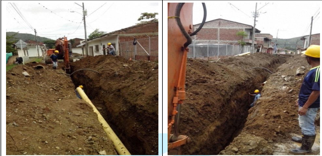
EXCAVACIÓN PARA INSTALACIÓN DE TUBERIA PVC SANITARIA