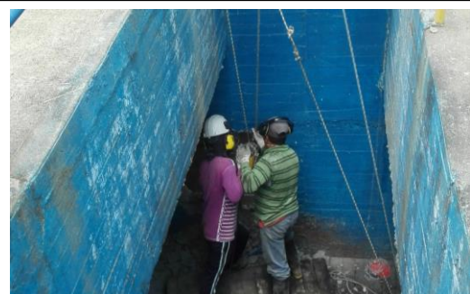
TRABAJOS DE DEMOLICION PARA EMPALMAR A PLANTA EXISTENTE

Los componentes de la obra, desarenador y la conducción, se encuentran terminados. La red de distribución se ha instalado en un 100%. Para suplir el abastecimiento que se pretendía realizar por la entrada N° 5 del lago Calima, se replanteo una extensión de red por la entrada N° 4 permiso que fue tramitado ante la alcaldía de Calima-Darién, obteniéndose el permiso para la ejecución de la obra. En la actualidad se encuentra a la espera de que los usuarios de esta ampliación de redes realicen las gestiones correspondientes ante EMCALIMA, para obtener el servicio de agua potable.