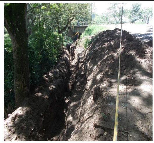
Excavación a máquina para instalación de tubería PVC presión D=10" RDE