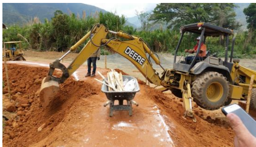
Conformación del jarillon a cota final

A la fecha, se encuentra en el proceso de conformación de los taludes del jarillon en la cota final y los 6 espolones se encuentran terminados, como se muestran en las siguientes fotos.