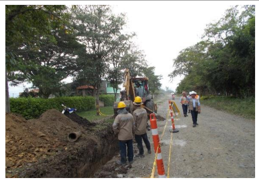
Excavación a máquina para instalación de tubería.