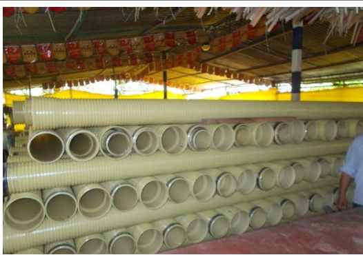
Suministro de tubería PVC Alcantarillado en diferentes diámetros.