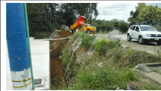
TANQUE DE ALMACENAMIENTO: RELLENOS PERIMETRALES